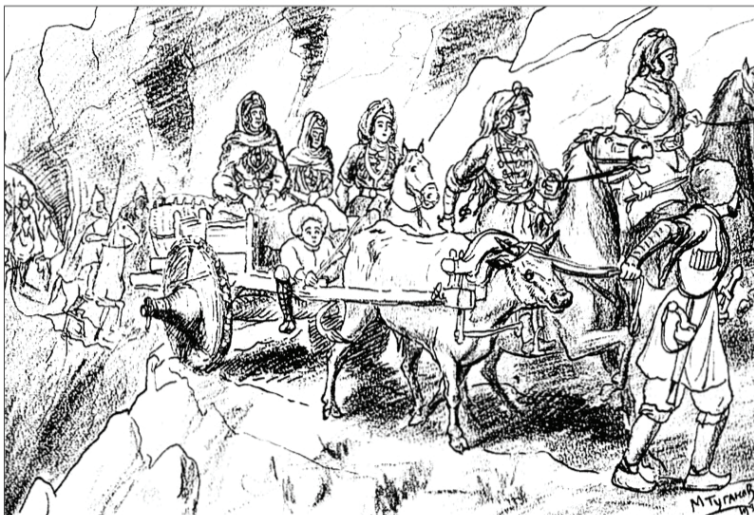
Ацы нывы сыхаг уынут БÆДИАТЫ Гадзийы. Нывгæнæг ТУГЪАНТЫ Махарбег æй скодта, хæстон уынаффæдонмæ цæугæйæ.

Ирон сылгоймагæн йæ фарн бирæ у. Нарты Сатанайы фарн ыл æфтыд у. Кадæджы Зæри-сæры чызджы чызгæфсады сгу-